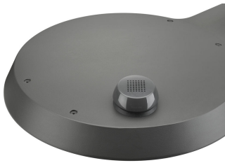
TownTune ASY BDP265