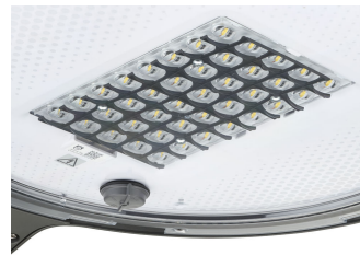
TownTune ASY BDP265