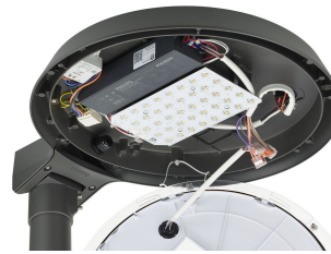
TownTune ASY BDP265