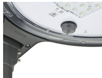
TownTune ASY BDP265