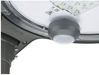
TownTune ASY BDP265