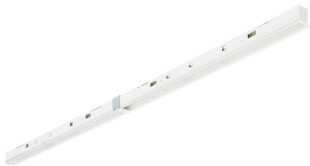
TrueLine Recessed Line OC