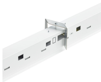
TrueLine- RC530_RC531_RC532_RC533B_P CV-2DPP.tif