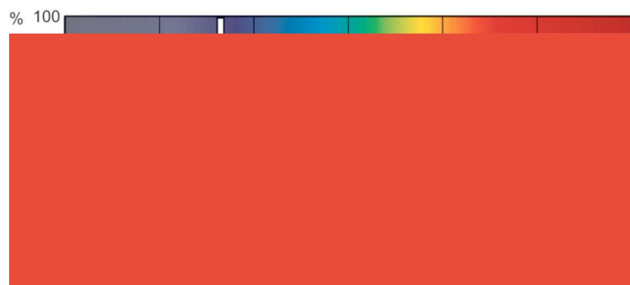
XDPB_XDMSR_SA-Spectral power distribution B/W