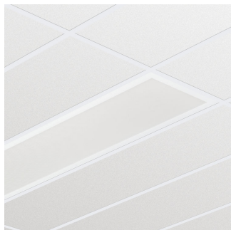
SlimBlend recessed mod. 600