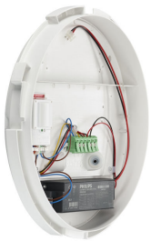
CoreLine_Wall-mounted- WL131V_D35_CTO_PSR_MDU- DPP.TIF